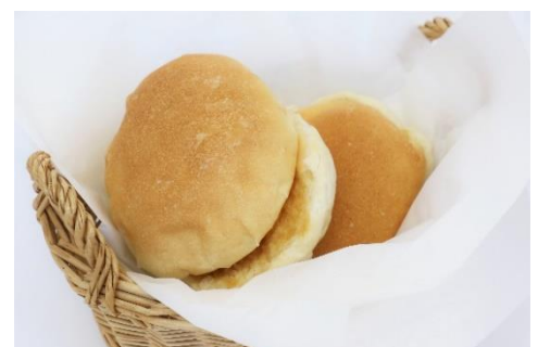
沼田市名物「みそパン」