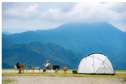
・ハンターテラス

ベース標高1,200mのスキー場のゲレンデを活用したキャンプ場。広大な敷地を活かした贅沢な区画サイト、東京の気温よりおよそ10℃低い涼しさや圧巻の星空が楽しめることが魅力です。2024年7月27日には標高1,400mのエリアに専用ゲストハウスを備えた5サイト限定プレミアムエリアがオープンいたします。3月に閉鎖したグループのスキー場「マウントジーンズ」で使用していたゴンドラキャビンを活用した専用サウナを備えたハンターテラスや、白樺の木々に囲まれたホワイトバーチヒルズなど、贅沢な空間で他にはないキャンプをお楽しみいただけます。