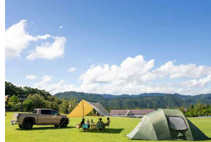
・ハンタービューサイト