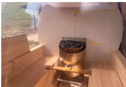
・ゴンドラサウナ室内